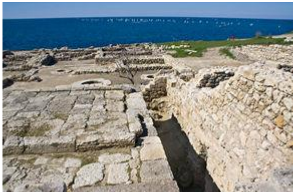
Основание алтаря храмового комплекса

Во второй половине IV в. до н.э. территория города была значительно расширена. Именно тогда город и был распланирован по системе милетского архитектора Гипподама. Древняя оборонительная стена была тогда разобрана, а новая оборонительная линия прошла гораздо западнее. При решении вопроса о священном участке (пещере), оказавшемся теперь почти в центре города, античные архитекторы находят выход в строительстве здесь храмового комплекса. Его композиционным центром стала сама пещера, включенная в основание храма.