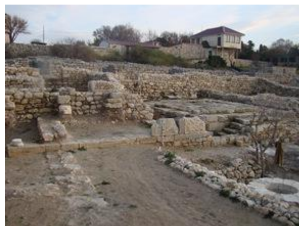
Общий вид участка с храмовым комплексом после раскопок