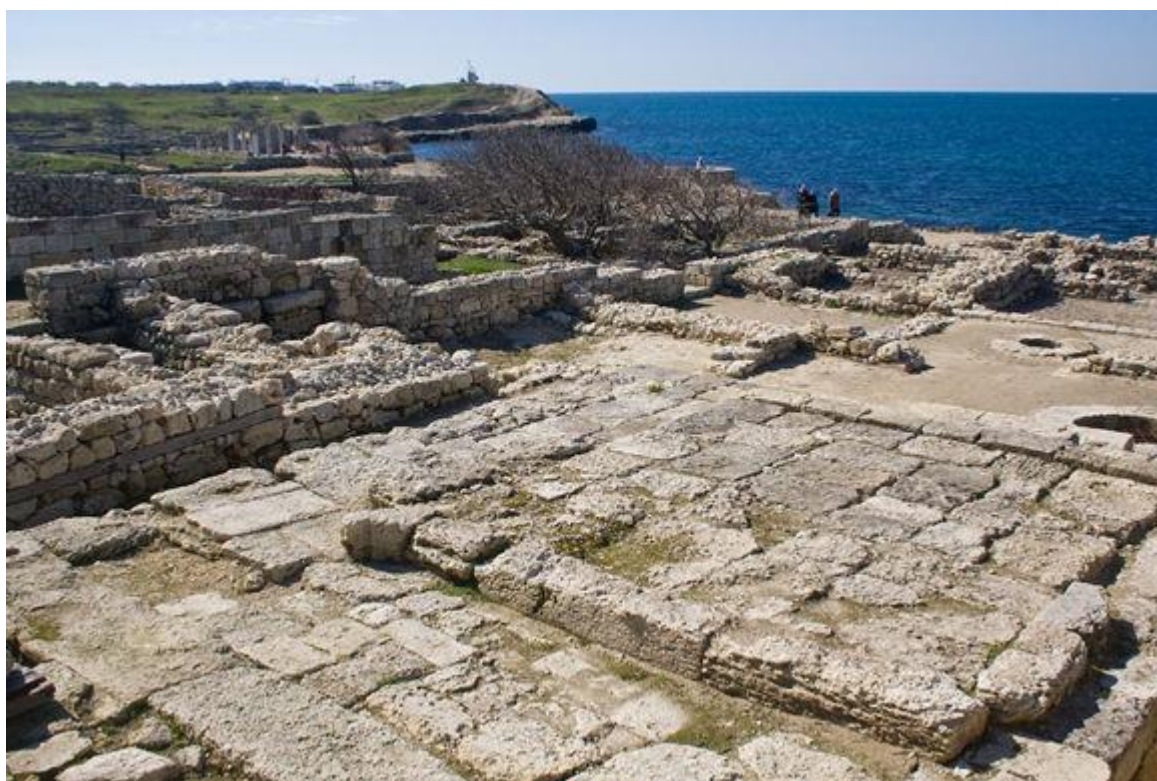
Храмовый комплекс с основанием алтаря. Вид с юга

Результатом проведенных работ стало открытие четырёх средневековых жилых усадеб, а также «храмового комплекса» конца IV в. до н.э. – IV в. н.э.