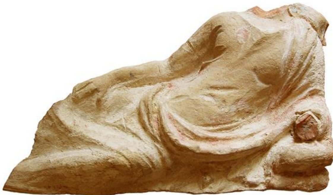
Фрагменты терракотовых статуэток, найденных при раскопках Храмового комплекса

Из эпиграфических находок интерес представляют надписи – проксения (торжественный акт дарования прав чужеземцу), выданная в I в. н.э. жителю города Амастрии (располагалась на территории совр. Турции) Гаю, сыну Антиоха.