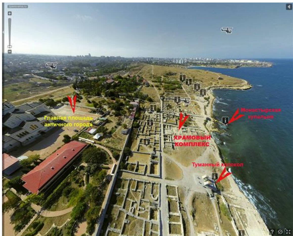
Вид участка с воздуха.

Для размещения народа, с северной стороны от храма была устроена площадь. Чтобы попасть в храмовый комплекс из центра города, нужно было пройти по двум поперечным улицам. Из западной части города к храму вела продольная улица. Таким образом, если мы посмотрим на архитектуру центра античного Херсонеса, то мы увидим единый ансамбль, состоящий из Главной городской площади, стоявших на ней храмов и «храмового комплекса», расположенного с северной стороны от площади.