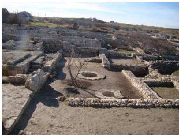
Общий вид двора и храмового комплекса после благоустройства