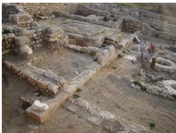
Храмовый комплекс после раскопок

Над ней, вероятно, возвышался так называемый «храм в антах» дорического ордера. С западной стороны от храма, на площади, воздвигается семиступенчатый алтарь.