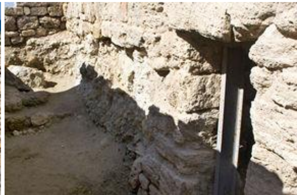
Вход в «священную пещеру»

Над ней, вероятно, возвышался так называемый «храм в антах» дорического ордера. С западной стороны от храма, на площади, воздвигается семиступенчатый алтарь.