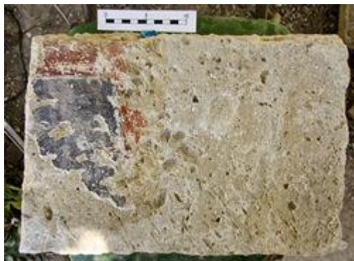
Фрагмент строительного блока с остатками фрески, идентичной обнаруженной в 2004 году в барбакане Воротной башни