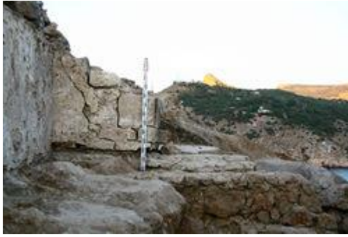
Фрагмент северной стены храма и входного проема