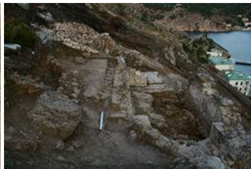
Общий вид на раскоп 2014 года с северо-востока