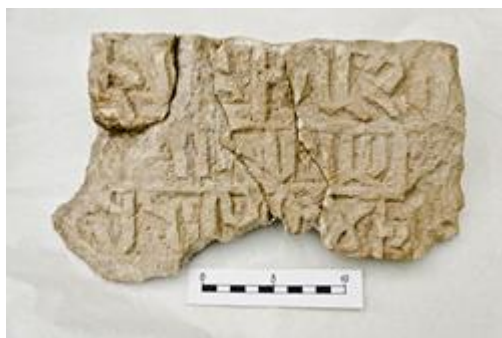
Фрагмент надгробия с армянскими надписями

Ниже (на второй террасе) открыты руины относительно небольшой церкви. Её размеры - 5,10 x 8,40 м. Толщина стен в среднем составляет 0,80 м. Сложены тщательно из разномерного бута на прочном песочно-известковом растворе. Ориентирован храм апсидой на северо-восток. Вход в строение находился с юго-запада (сохранился только южный откос). Апсида храма в форме полукруга, довольно глубокая, имела возвышение (выше уровня пола церкви – 0,20 м). Изнутри стены и апсида покрыты известковой белой штукатуркой. Местами сохранилось два слоя покрытия. Следов фресковой росписи не выявлено. В северо-западной стене прослежено основание окна, под которым в кладку была вмурована водопроводная труба (в качестве голосника?).