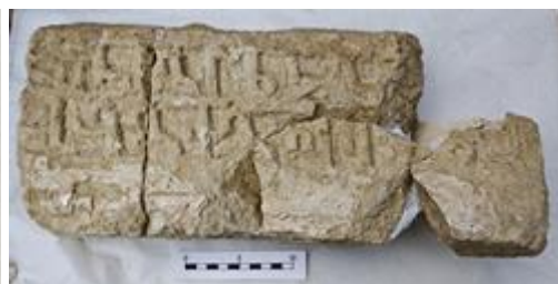
Фрагмент надгробия с армянскими надписями